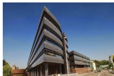
Conseil départemental du Bas-Rhin