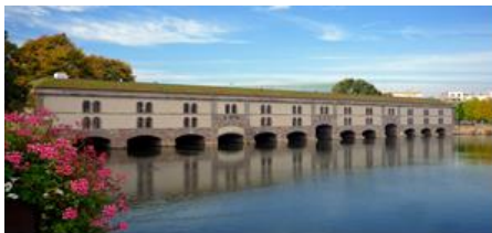
Barrage Vauban sur l'Ill

Contact : Fabienne SPOHR au 06 47 86 57 84